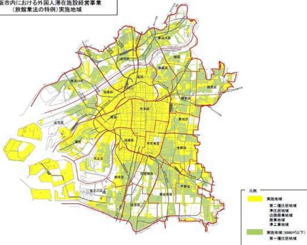
大阪市内における外国人滞在施設経営事業 (旅館業法の特例)実施地域